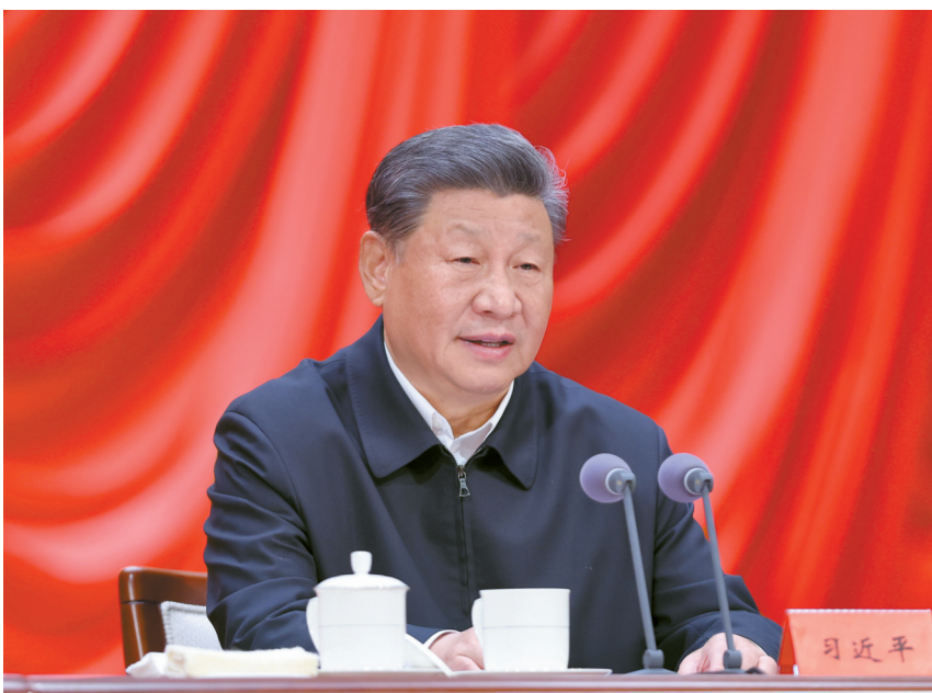
10月29日,省部级主要领导干部学习贯彻党的二十届三中全会精神专题研讨班在中央党校(国家行政学院)开班。中共中央总书记、国家主席、中央军委主席习近平在开班式上发表重要讲话。

习近平指出,改革是一项系统工程,需要讲求科学方法,处理好方方面面的关系。要坚持改革和法治相统一,以改革之力完善法治,进一步深化法治领域改革,不断完善中国特色社会主义法治体系;更好发挥法治在排除改革阻力、巩固改革成果中的积极作用,善于运用法治思维和法治方式推进改革,做到重大改革于法有据,平等保护全体公民和法人的合法权益。要坚持破和立的辩证统一,破立并举、先立后破,该立的积极主动立起来,该破的在立的基础上及时破,