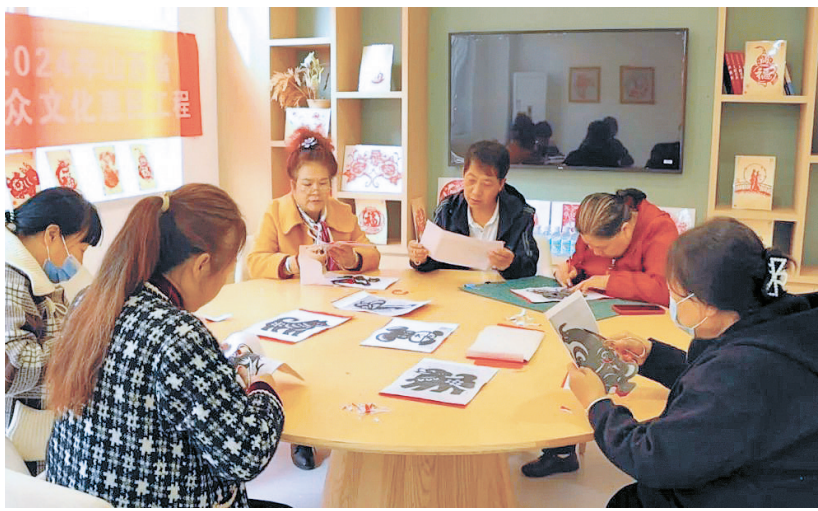
松溪路社区举办剪纸活动。

本报讯 10月23日上午11点多,昔阳德润幸福养老服务中心的餐厅就变得格外热闹起来,前来就餐的老人们排队登记后依次就座,一边拉着家常一边等待开饭。没过多久,工作人员就将热气腾腾的饭菜端了出来。从清淡可口的素菜到色泽诱人的荤菜,从美味的汤品到精致的面点,应有尽有。老人们井然有序地排队挑选着自己喜欢的饭菜,场面温馨惬意。