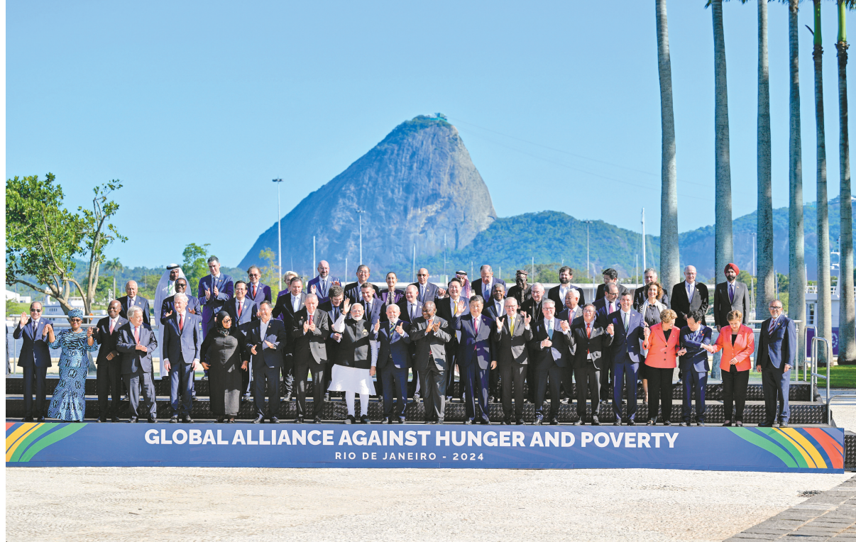
当地时间11月18日上午,国家主席习近平在巴西里约热内卢出席二十国集团领导人第十九次峰会。峰会把“构建公正的世界和可持续的星球”作为主题,并决定成立“抗击饥饿与贫困全球联盟”。这是习近平同与会领导人共同参加巴方发起的“抗击饥饿与贫困全球联盟”合影。