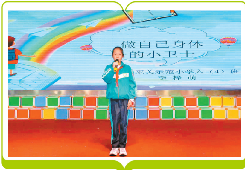
和顺县东关小学学生参加法治宣讲比赛现场。

本报讯 为加强青少年法治教育，切实提升未成年人法治素养与自我保护能力，近日，由和顺县人民检察院承办的晋中市“牵手杯”法治宣讲比赛和顺赛区分赛圆满落幕。来自全县各中小学的小学生、新初一、初二、新高一选手齐聚赛场，以“讲课时演讲”的独特形式，上演了一场别开生面的法治“盛宴”。