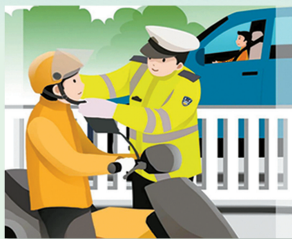
一盔一带 安全出行