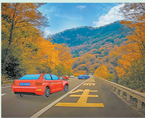
应急通道 生命通道