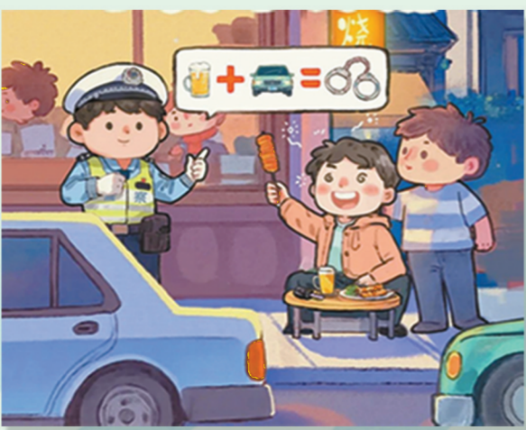
酒后莫开车 安全不打折