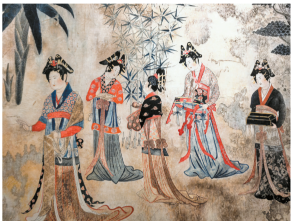
山西晋之源壁画艺术博物馆壁上丹青陈列展陈缩影图。

李哲指出,要加快现代农事综合服务中心建设,整合引导合作社、村集体、社会投资主体三方资源要素,为小农户提供集成式、一站式农业生产服务。要打造智慧农业管理新模式,利用信息技术优势,在种业研发、农业生产、农产品加工等方面进行信息化赋能,构建农业全产业链智慧应用场景。要全力破解有机旱作农业生产难题,以生物农药、生物化肥、节水农业为抓手,加快与RNA生物农药、微生物有机化肥、高效节水农业等科技企业合作,建设有机旱作农业新高地。(李楠)