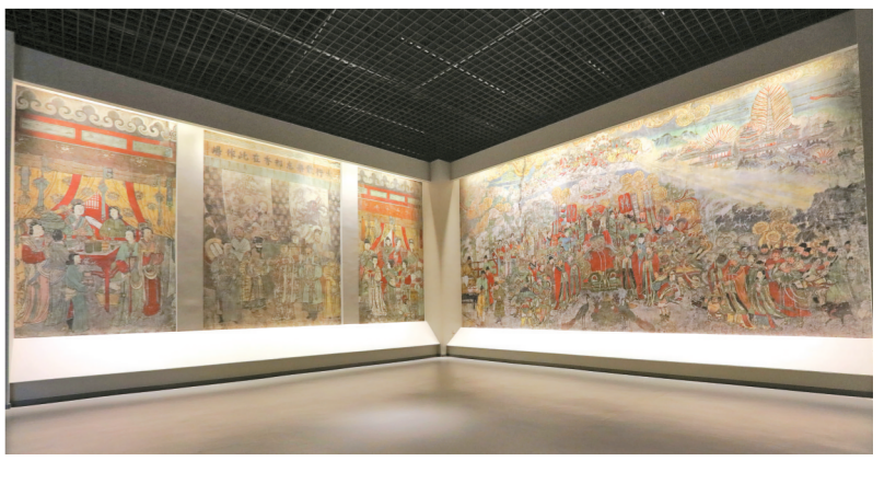
山西晋之源壁画艺术博物馆馆内一景。

“在壁画艺术博物馆,我们不再是古代壁画的旁观者、聆听者,还是壁画技艺的学习者,壁画艺术的守护人和传承人。”今年3月,来自中国常熟世界联合学院的12名师生走进山西晋之源壁画艺术博物馆,体验壁画修复技艺。师生们纷纷表示,了解是热爱的基础,实践是最大的热爱,今后会更认真学习,传承中华优秀传统文化,增强文化自信。