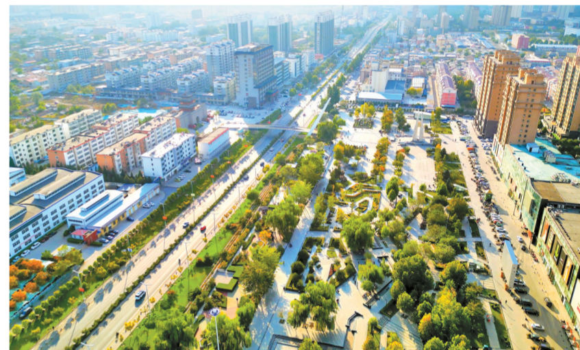
北城区以金谷广场为示范点,深化周边环境综合整治。王琪 摄

从党建引领到多元参与,从环境隐患的“精准破解”到物业服务的“场景创新”,从自治模式的“超前布局”到惠民工程的“直达快办”,安泰社区以多元化特色举措推动精细化治理走深走实。未来,社区将持续深化多元共治模式,永葆精耕细作的匠心,不断提升社区治理水平,让城市更宜居、群众更舒心,绘就基层治理现代化的美好画卷。(白媛)