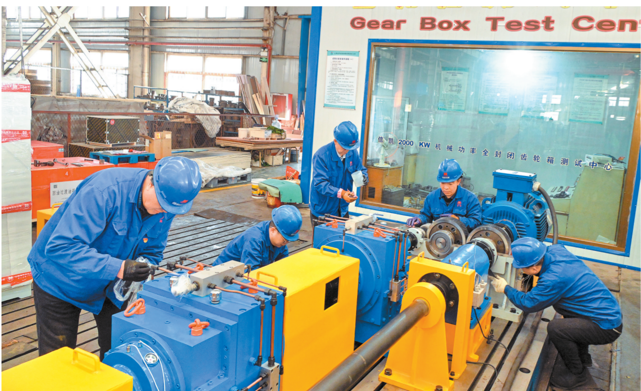
12月2日,在平遥减速机有限责任公司车间,技术人员正在装配、检测新产品。近年来,该公司认真贯彻落实中国制造2025规划,技术创新研发力度不断提升,高端产品比重大幅增加,企业高质量发展释放了新活力,跑出了“加速度”。