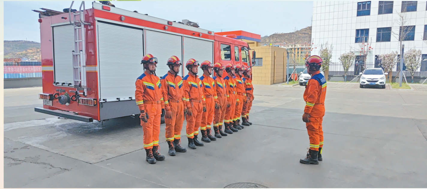
消防救援队伍日常训练

安全生产重于泰山,消防安全关乎千家万户的生命财产安全。近年来,灵石县消防救援大队始终坚持“预防为主、防消结合”的工作方针,将消防安全工作融入县域经济社会发展大局,通过精准宣传、严格监管、强化备战三维发力,织密织牢消防安全防护网,为全县高质量发展营造稳定安全环境。