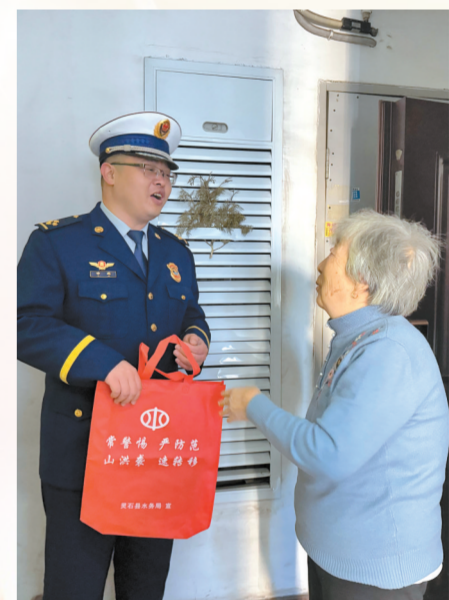
消防救援大队工作人员向居民讲解“三清”工作的重要性