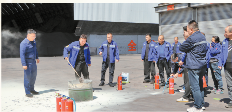
企业开展消防演练

聚焦农村地区防火薄弱环节,灵石县消防救援大队巧用乡村“大喇叭”,赶集日设点宣讲等接地气的方式,用灵石本地话讲解安全用火用电、秸秆焚烧危害、冬季取暖