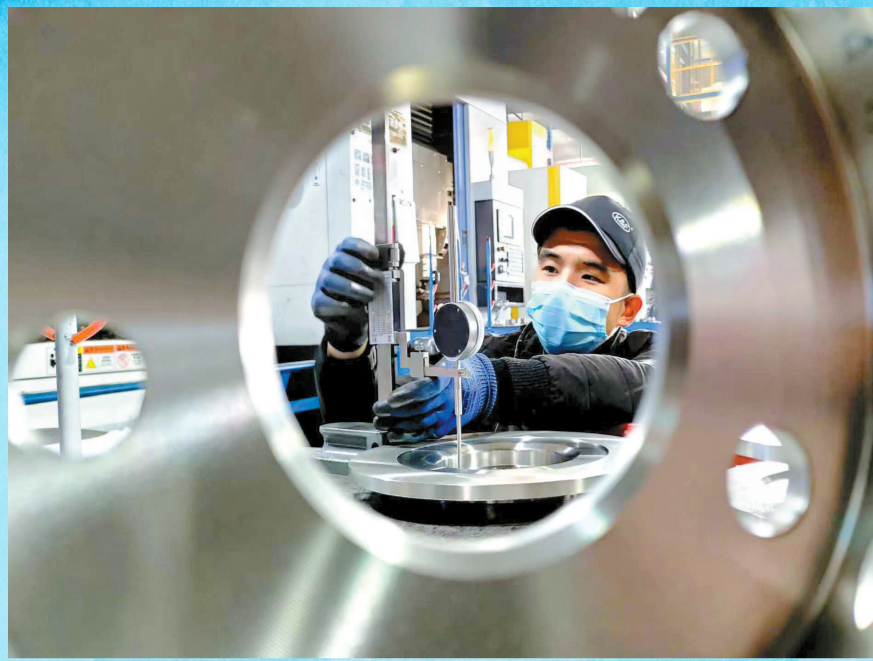
精准产品中心孔精度