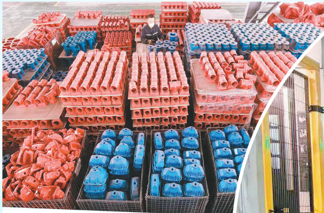
生产车间玛钢成品整装待发