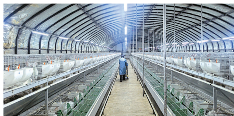
祥兔园标准化兔舍整齐排列。