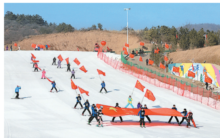
2025年冬季旅游促消费活动暨昔阳县冰雪嘉年华启幕现场。

本报讯 银装素裹绘盛景，冰雪欢腾启新章。12月19日，“怡然见晋中·欢乐冰雪季”2025—2026年冬季旅游促消费活动暨昔阳县冰雪嘉年华在山西崇家岭牧云滑雪场正式启动。