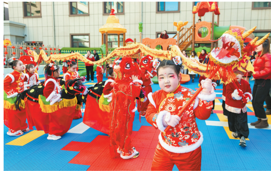
▲2025年12月31日,左权睿思幼儿园举办了别开生面的元旦庆祝活动。活动通过文化浸润、医育融合、亲子共育与能力培养,为幼儿及家庭带来一个充满传统韵味与健康理念的新年开端。