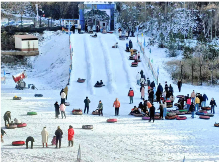
▲1月1日,太谷区田园东谷温泉康养小镇首届冰雪节开园,来自周边县市的游客纷至沓来,现场气氛热闹非凡。