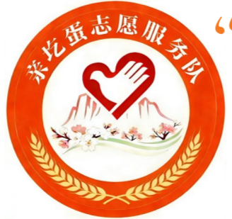
「亲挖蛋」品牌标志 左权青年志愿者

本报讯 (记者闫晓媛 通讯员张晶)2月4日,左权县政府会议室内气氛热烈,一场意义深远的活动在此举行——左权青年志愿者品牌“亲挖蛋”正式发布。