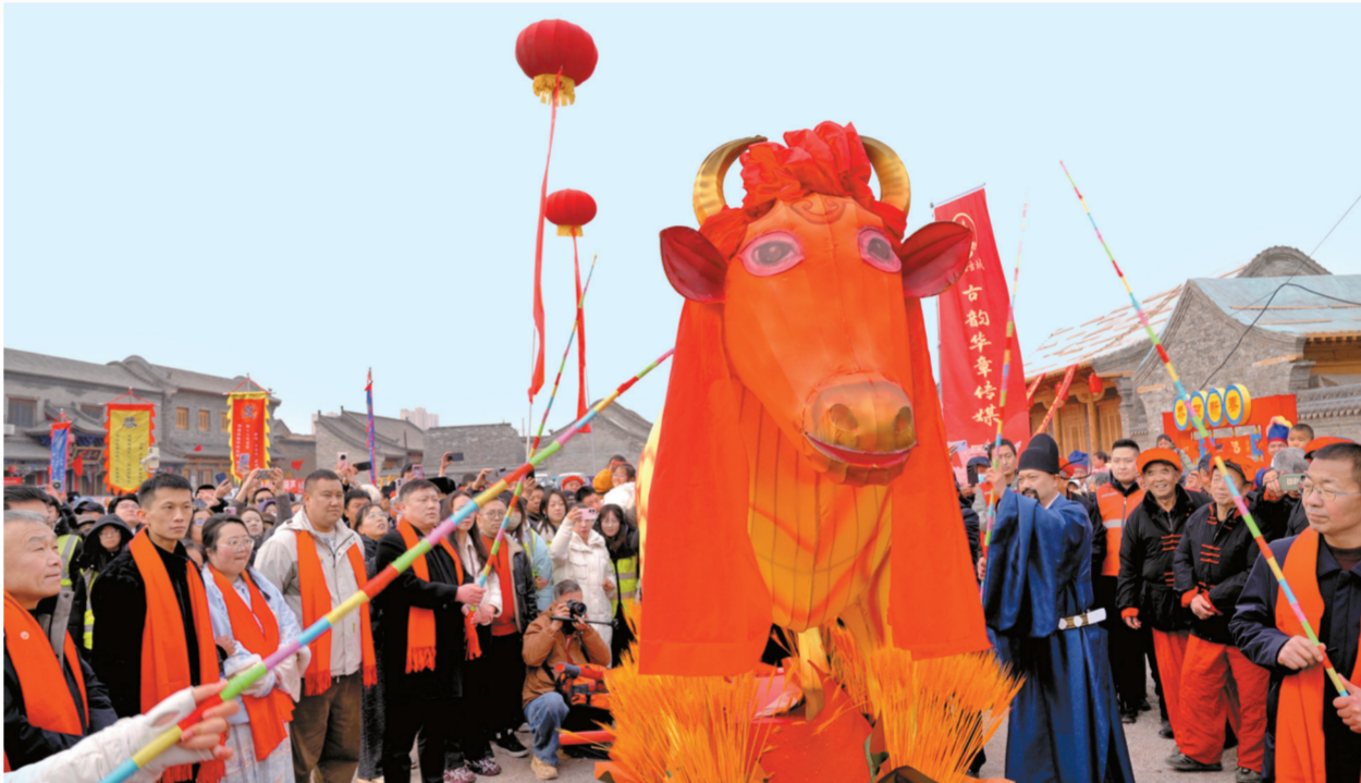
太谷“打春牛”活动现场。