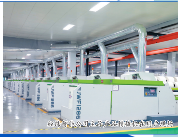
经纬智能公司主导产品精梳机在用户现场