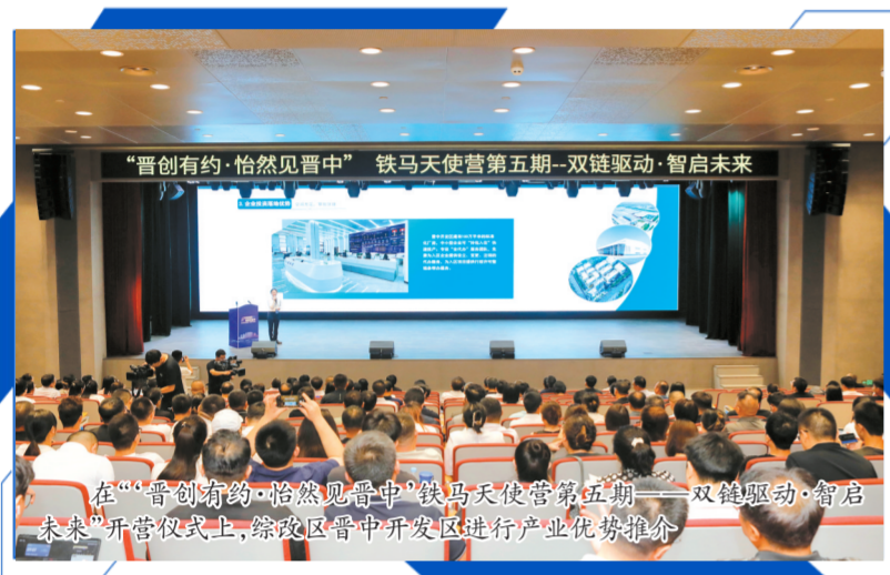
在“晋创有约·怡然见晋中”铁马天使营第五期——双链驱动·智启未来”开营仪式上,综改区晋中开发区进行产业优势推介

2025年,综改区晋中开发区迎来“十四五”收官的关键节点。作为全市转型综改的排头兵、高质量发展的主阵地,综改区晋中开发区深入贯彻落实中央及省委、市委各项决策部署,全区上下和衷共济、真抓实干,以“稳”的基调夯实发展根基,以“进”的态势激活发展动能,以“创”的活力培育新质生产力,以“优”的服务厚植发展沃土,在工业增长、招商引资、产业升级、项目建设、创新驱动、绿色发展等方面取得突破性成效,为开启“十五五”发展新征程筑牢坚实基础,交出了一份亮眼的高质量发展答卷。