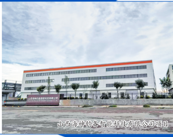
山西海科药谷智能科技有限公司项目