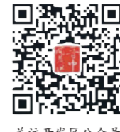
关注开发区公众号 掌握发展前沿报道

从车间里的轰鸣生产线到商圈中的热闹烟火气,从创新平台的思维碰撞到项目工地的热火朝天,综改区晋中开发区用一组组亮眼数据、一个个扎实举措,交出了一份含金量足、获得感强、后劲力实的“十四五”收官答卷。站在“十五五”开局的新起点,综改区晋中开发区将继续保持定力、满怀信心、脚踏实地、接续奋斗,以更昂扬的姿态扛起综改使命,以更务实的作风推动高质量发展,为山西中部城市群建设注入更强“晋开力量”,在新征程上书写更加精彩的发展篇章。