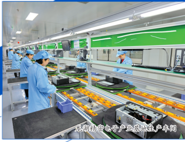
龙湖精密电子产业基地生产车间

新产业链招商、以商招商、基金招商、标准厂房招商等模式,围绕“3+1+3”产业体系精准发力,51个医疗器械项目成功落地,形成“引来一个、带动一批、辐射一片”的产业集聚效应,让招商引资的成果真正转化为发展的实效。