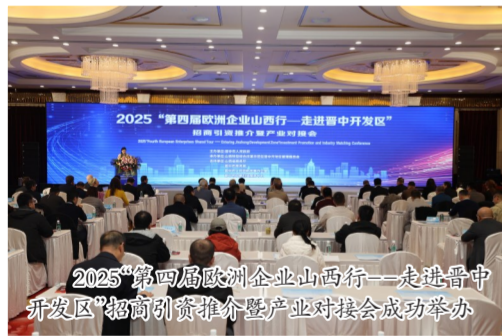
2025“第四届欧洲企业山西行——走进晋中开发区”招商引资推介暨产业对接会成功举办