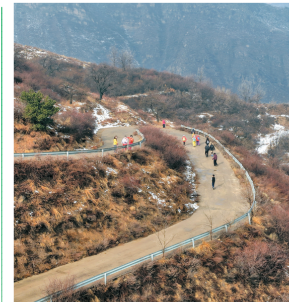
3月15日,天气转暖,春意萌发,大谷区侯城乡境内南山片区的多处山桃花迎春绽放,吸引了众多群众登山观景和户外踏青。