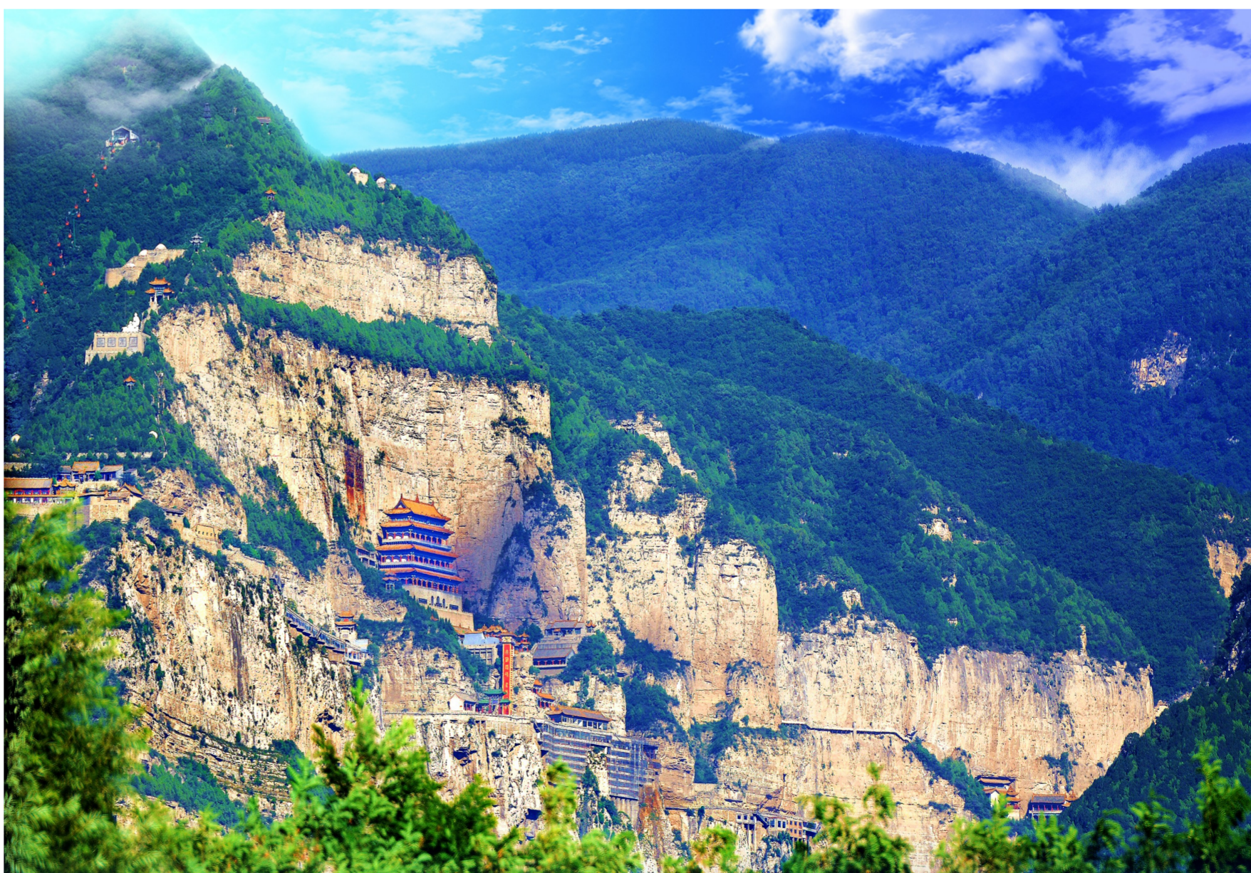
寒食清明文化的发源地——介休绵山。

坚实的物资装备是森林防火的重要保障。介休市强化物防支撑,配备专业消防车辆、灭火装备、防护用品及应急设备,各涉林乡镇、防火卡口足额配备扑火物资,全力做好备战春季防火灭火各项准备工作,确保第一时间反应、第一时间到位、第一时间处置,守护森林生态安全,确保介休市森林防火形势持续安全稳定。(王皓宇)