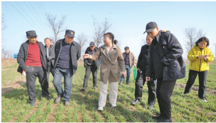
农技专家深入田间地头开展技术指导服务。

本报讯 春回大地,农事渐忙。随着气温回升,介休市冬小麦陆续进入返青生长关键阶段。为切实抓好春季麦田管理,夯实夏粮丰收基础,近日,介休市农业农村局组织农技专家下沉一线送技术、解难题,开展“面对面、手把手”技术指导服务,为冬小麦稳产增产保驾护航。