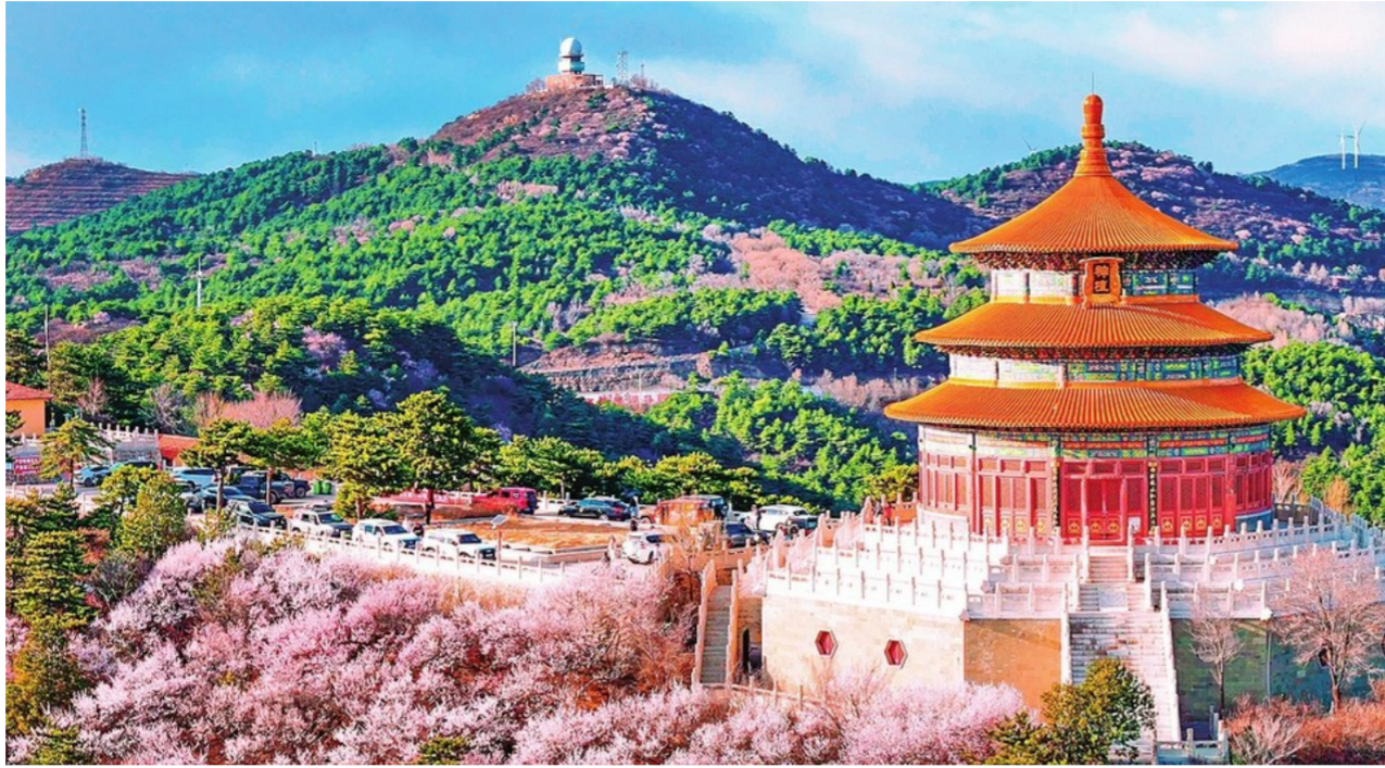
乌金山桃花盛开，春意正浓。

祁县三地文旅资源，推出三条春季精品路线，将田园采摘、春日赏花与晋商文化有机融合，推动农文旅深度融合发展，进一步擦亮“怡然见晋中”城市文旅品牌。