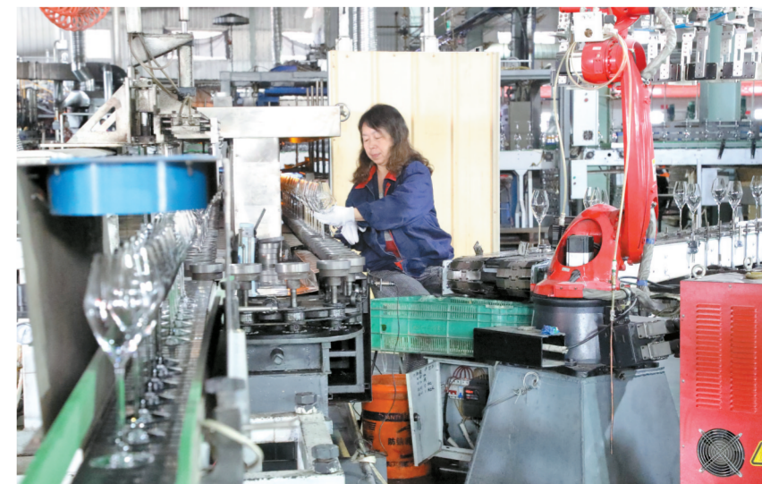
近年来,祁县立足玻璃器皿产业深厚底蕴,持续整合政策、资本、人才等资源,搭建创新平台,引导企业打破传统生产模式束缚,在技术攻关中破局求突破,在工艺创新中升级谋进阶,推动玻璃产业从“制造”向“智造”加速蝶变。图为祁县东玻璃股份有限公司生产车间。

标合格证开具不规范等问题,严厉打击肉制品领域私屠滥宰、病死畜禽流入市场等违法行为,坚决杜绝重大农产品质量安全事件发生,以最严监管牢牢守护人民群众“菜篮子”安全。 严管重点领域。渔政方面,加大禁渔期巡查频次,清理取缔涉渔“三无”船舶,重拳整治电鱼、毒鱼、炸鱼等非法捕捞行为,守护水域生态安全。农机方面,紧抓春耕备耕关键农时,严查无证驾驶、违规载人、无牌作业及跨区作业不合规等隐患,有效防范遏制农机事故发生,全力保障作业人员及人民群众生命财产安全。