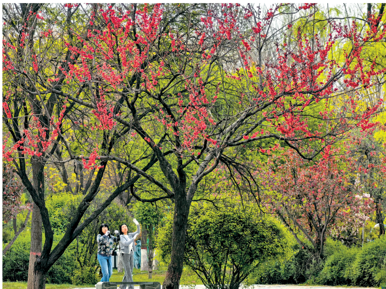
4月21日,市区内公园内繁花竞放、春意盎然。市民趁着晴好天气,在桃红柳绿间舒展身姿、运动锻炼,在如画春光中享受健康生活。

消防部门提示:正值榆钱、槐花采摘季,不少人喜欢前往野外采摘。老年群体应尽量避免独自前往野外、山坡、沟谷等危险区域。若确有采摘需求,务必随身携带手机,提前告知家属自己的出行路线、目的地及预计返回时间。如遇坠落、被困等紧急情况,应保持冷静,切勿盲目攀爬、挣扎,防止身体受到二次伤害,并第一时间报警求助。