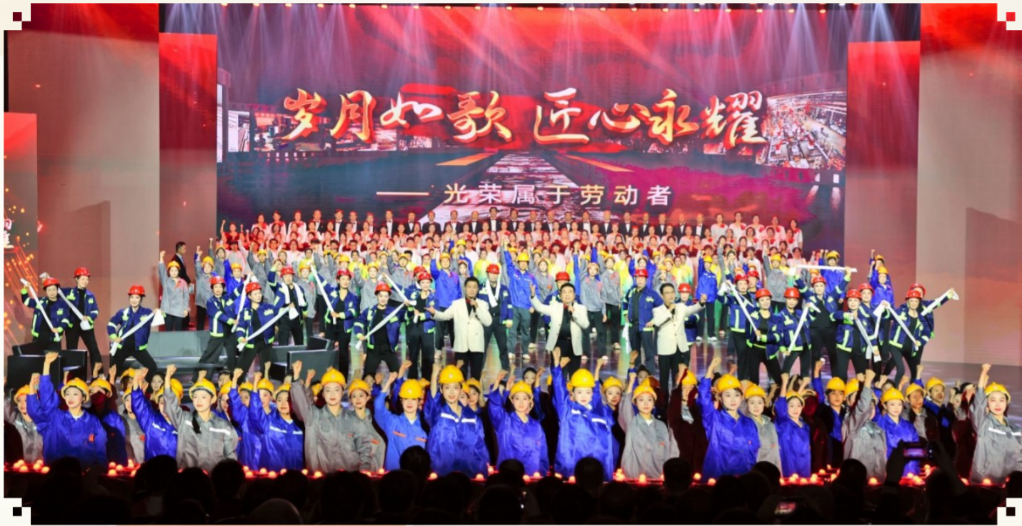
庆祝「五一」国际劳动节特别活动。

4月29日,我市举办“岁月如歌、匠心永耀——光荣属于劳动者”庆祝“五一”国际劳动节特别活动,共同见证属于劳动者的光荣时刻。当天,晋中市总工会正式发布了2026年工会工作总体要求和主要任务。