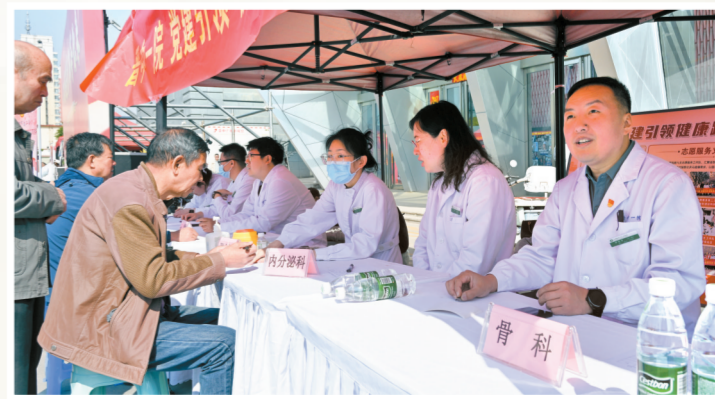
晋中市总工会举办“关爱守护健康·普惠温暖职工”专场活动。