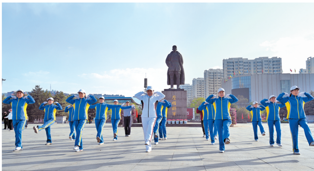
5月11日，市民在左权将军广场进行健身晨练。随着生活品质的不断提高，“我运动、我健康、我快乐”的理念深入人心，越来越多的人积极参与到健身锻炼中，推动了全民健身计划的实施。