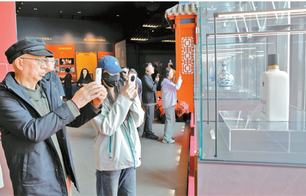
近日，游客走进祁县红星二锅头酒博物馆参观游览，沉浸式领略传统酿造工艺的深厚底蕴。该场馆深挖文化内涵，做强工业文旅特色，为地方文旅产业发展注入新活力。