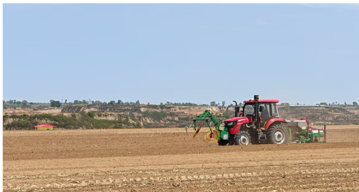
西洛镇科研基地“高碳有机肥局域深施快速提升地力技术”落地应用。