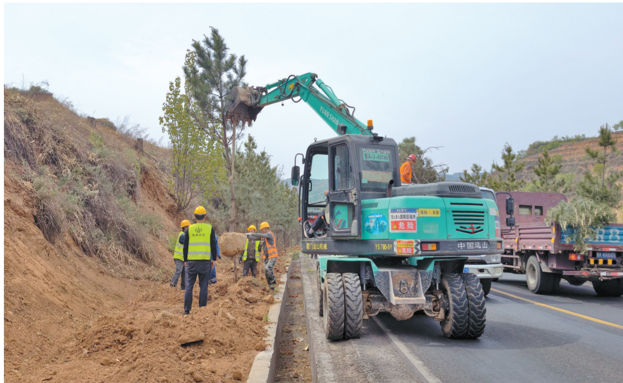
在产业廊带建设项目 G339 国道金石咀村段现场,施工人员进行栽植树木。