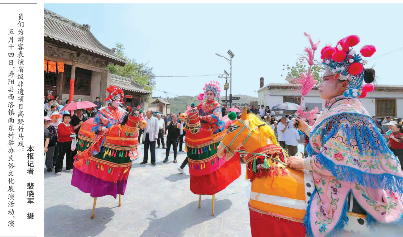
五月十四日,寿阳县西洛镇南东村举办民俗文化节展演活动,演员们为游客表演省级非遗项目高跷竹马戏。

县域强则经济强,县域活则全盘活。一季度,我市工业大县(市)灵石、介休、寿阳、昔阳工业增加值均高于全市平均水平,为全市工业经济增长作出积极贡献。左权、和顺两个产煤县的工业增速也高于全市平均水平,成为全市工业增长的助推器。