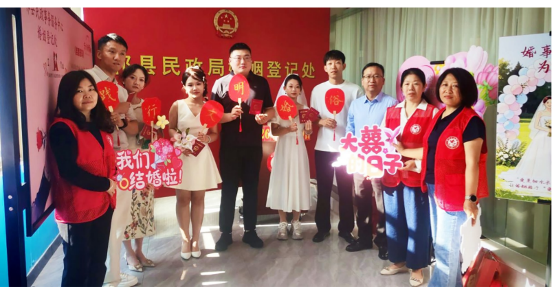
新人与志愿者在婚姻登记处合影。