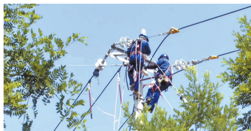
电力施工人员进行登杆作业。