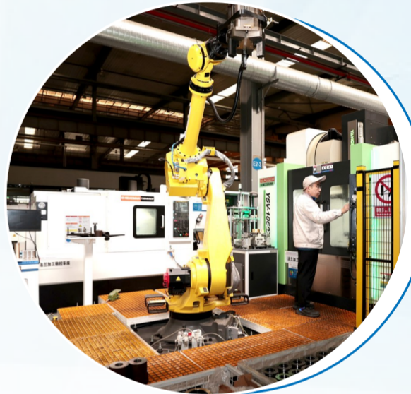
太重榆次油缸车间

与此同时,综改区晋中开发区持续推动治理模式智慧化,建设碳能智慧管理平台,实现能耗与碳排放实时监测、精准调控和智慧决策,重点企业碳排放监测覆盖率达90%,完成60户重点企业数据采集器安装并上线,对4户重点用能企业能耗在线监测系统运行常态化指导;开发减污降碳协同智能管控平台,实现“三废”(废水、废气、固废)产量、排放量、处理量数据联动分析,113家重点气体排放企业、135家重点污水排放企业数据归集入库;打造山西“双碳”会