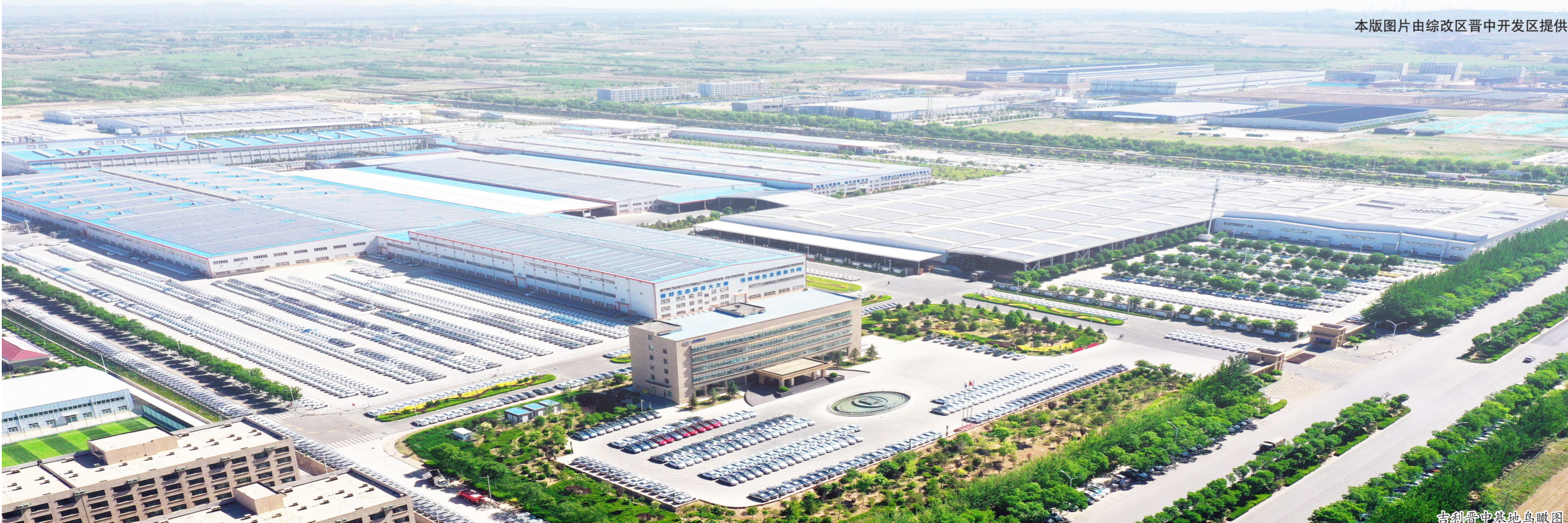
晋创晋中基地鸟瞰图