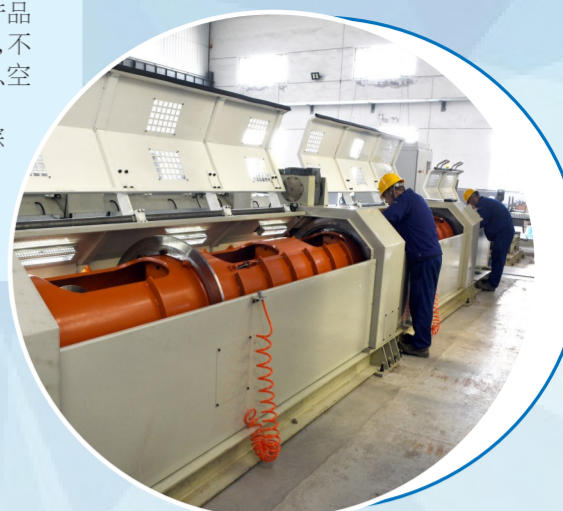
远大线材钢丝绳车间合绳工序

色设计理念,开展产品碳足迹评价,确保产品指标国内领先,高端产品达国际先进水平,不断优化能源结构,建立能碳平台,利用余热、空气能、光伏等资源,实现节能降碳……一批拔节生长的企业不断涌现,成为综改区晋中开发区推动产业现代化发展的有力支撑。