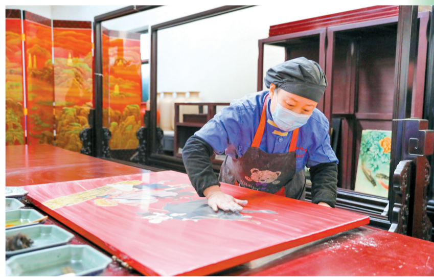
平遥推光漆器,一推一磨,漆光凝萃东方匠心,沉淀千年文化底蕴。