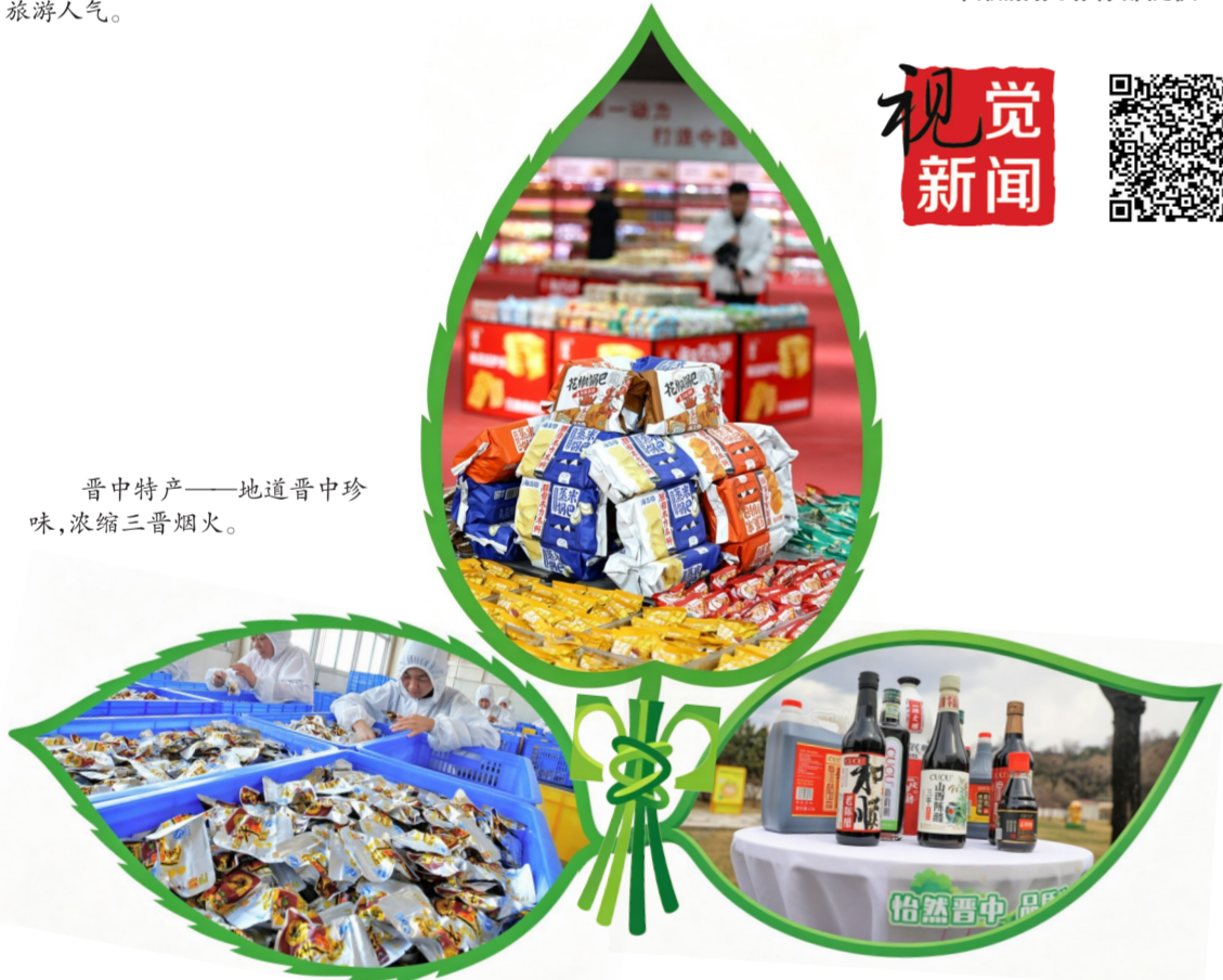
晋中特产——地道晋中珍品,浓缩三晋烟火。