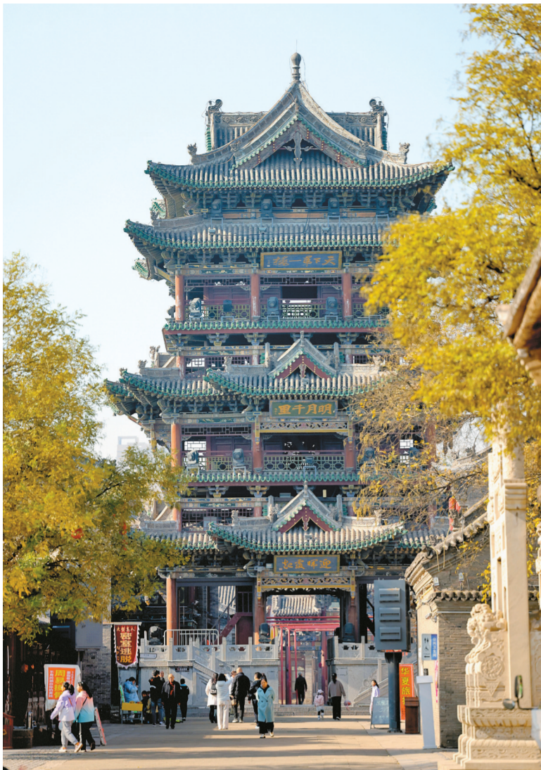
榆次老城建筑造型精巧繁复,飞檐翘角搭配彩漆木构,匾额古韵浓厚,尽显晋中千年古城的明清古风风貌与市井烟火气息。