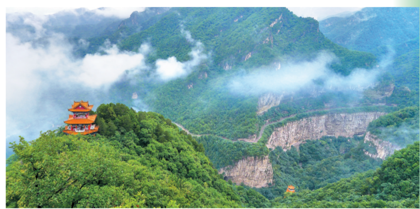
灵石石膏山满目葱郁,奇峰绝壁间云雾缭绕。

以赛为桥聚四海宾朋,以文润城展一城风华。我市全力打造集竞技观赛、古城观光、山水游览、非遗体验、美食品鉴于一体的文旅体盛宴,让世界看见晋中,让晋中拥抱世界。让我们相约晋中,共赴激情赛事,共赏锦绣山河!