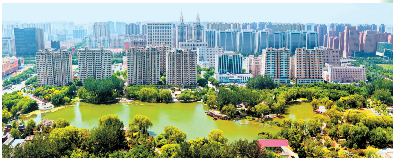
主城区公园湖面碧波荡漾,绿树葱郁繁茂,周边高楼鳞次栉比,尽显宜居城市秀丽风貌。