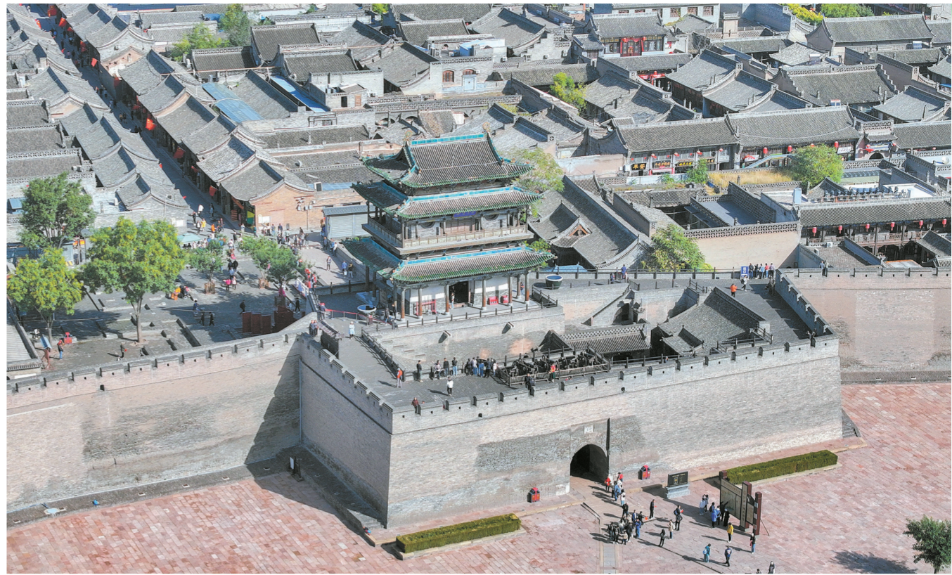
高空俯瞰平遥古城,厚重青砖城墙巍峨矗立,重檐古楼阁精巧典雅,完整展现保存完好的明清古县城风貌。

当千年文脉邂逅激情赛事,当怡然风光拥抱青春热血,2026年第二十五届世界U20女子手球锦标赛即将在“甜美晋中”拉开帷幕。这是一场以青春赴盛会的激情相约,是一次“体育+文旅”的华美交响。以球会友,以赛为媒,让我们跟着赛事去畅游晋中,乐享晋中,读懂晋中。