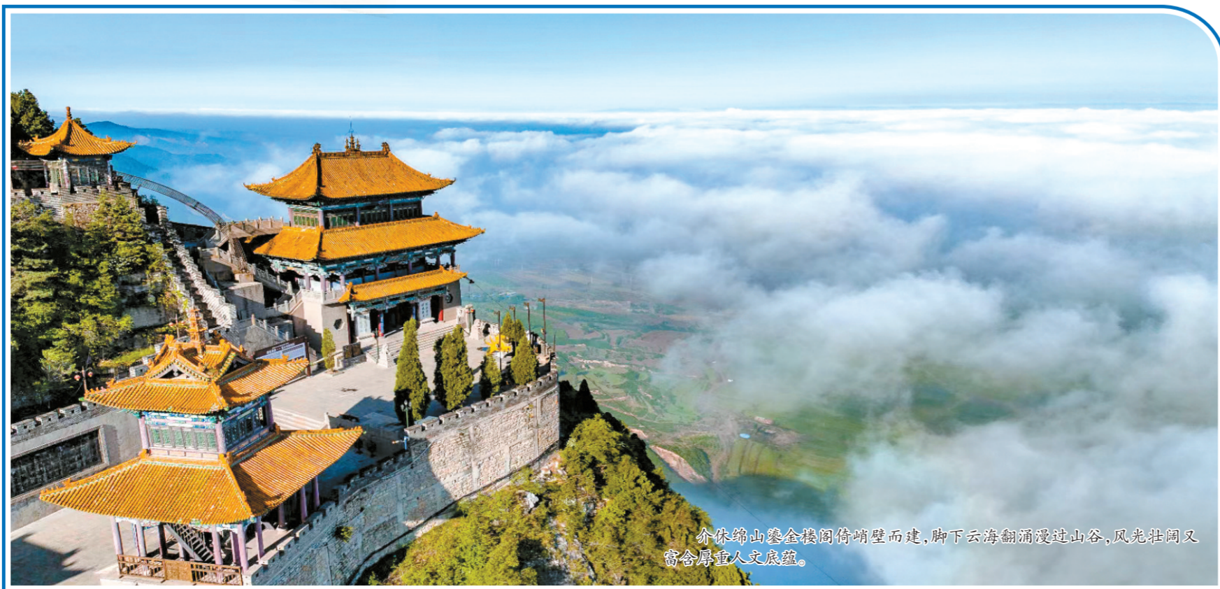
介休绵山崇金楼阁倚峭壁而建,脚下云海翻涌漫过山谷,风光壮阔又富含厚重人文底蕴。