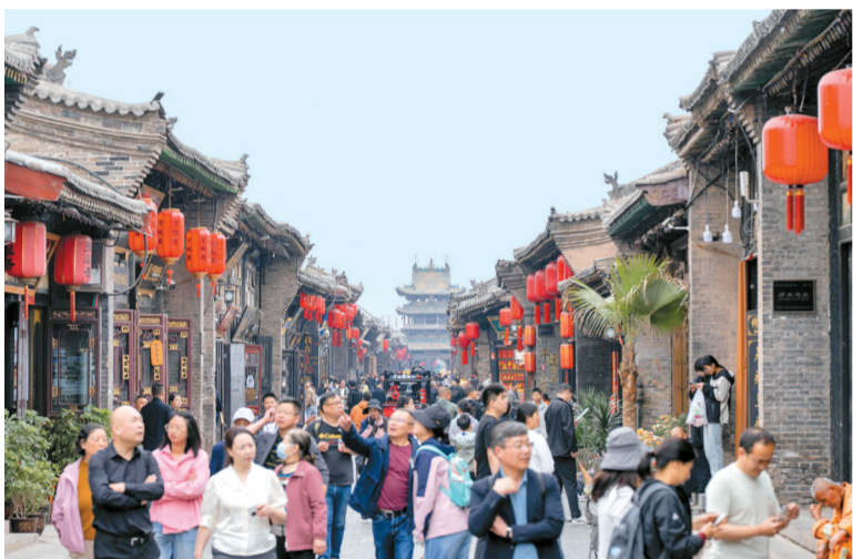
平遥古城南大街游人熙攘,烟火浓郁,尽显古城千年商贸古韵与旺盛旅游人气。