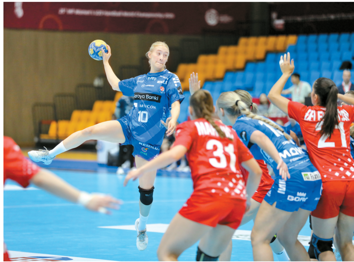
2026年第二十五届世界U20女子手球锦标赛比赛现场,法罗群岛球员腾空跃起攻门,克罗地亚队员合力上前封堵,双方高强度对抗一触即发。

本报讯 (记者王志敏)6月26日为2026年第二十五届世界U20女子手球锦标赛休赛日。市气象台结合参赛运动员外出游览需求,发布榆次老城、平遥古城专题气象预报。根据预报,26日榆次、平遥天气以多云间晴为主,午后有分散性阵雨或雷阵雨,降水量约0.1毫米,全天风力柔和,均为微风。榆次老城8时至14时多云、气温24℃至28℃;14时至17时多云有分散性阵雨或雷阵雨,气温28℃至30℃,17时至20时维持多云天气,气温稍有回落。平遥古城8时至14时多云,气温26℃至29℃;14时至17时多云有分散性阵雨或雷阵雨,气温升至29℃至31℃;17时至20时转晴,气温小幅回落。