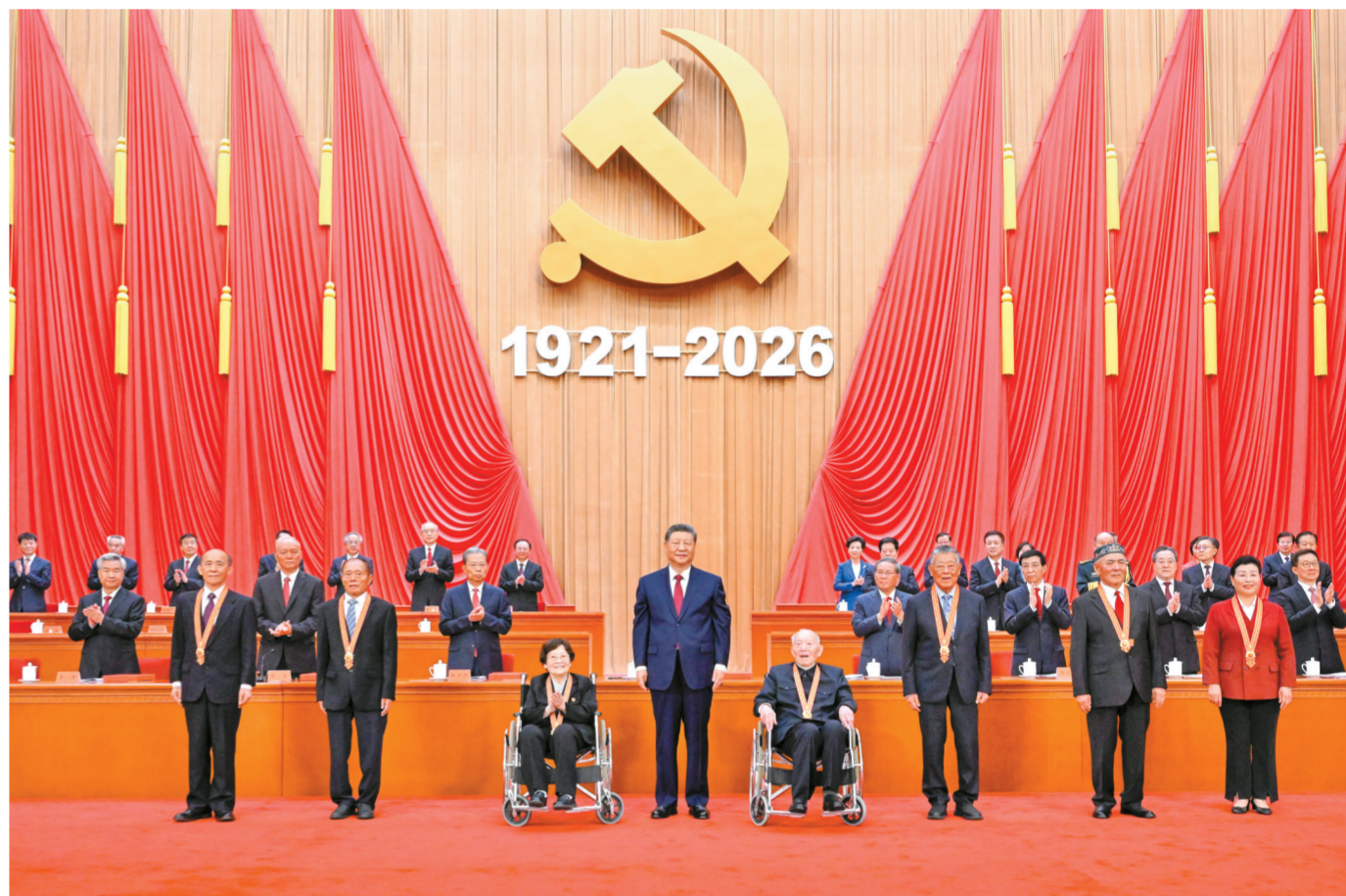
7月1日上午，庆祝中国共产党成立105周年大会在北京人民大会堂隆重举行。中共中央总书记、国家主席、中央军委主席习近平向“七一勋章”获得者颁授勋章。

新华社北京7月1日电 庆祝中国共产党成立105周年大会7月1日上午在北京人民大会堂隆重举行。中共中央总书记、国家主席、中央军委主席习近平向“七一勋章”获得者颁授勋章并发表重要讲话。他强调，105年来，我们党始