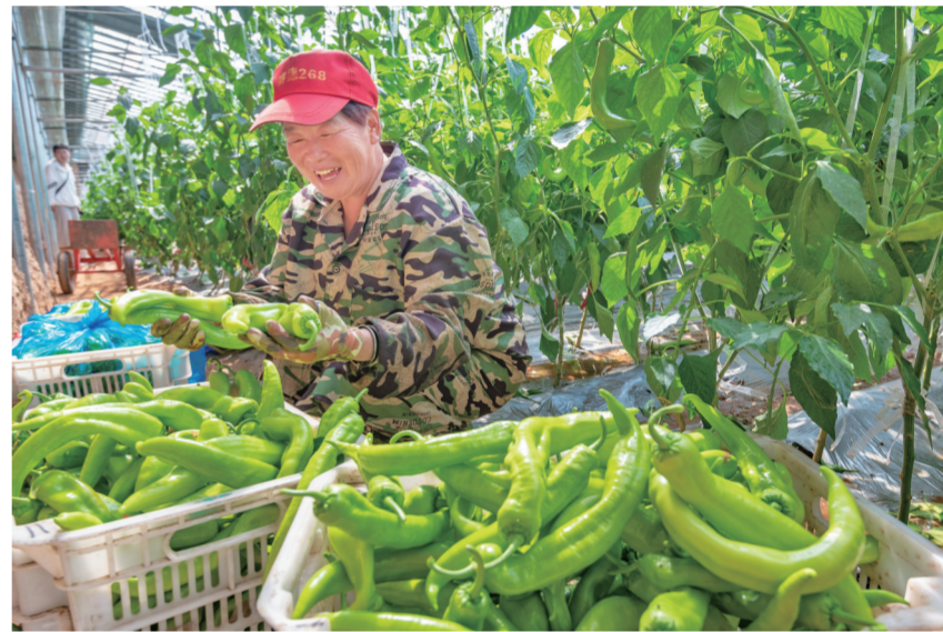
7月5日,在左权县寒王乡丰瑞种植园内,菜农们正忙着采摘成熟的辣椒,准备装箱外运,供应市场。近年来,该种植园引进先进设施农业技术,建起4栋高标准日光温室、51个春秋拱棚及1栋智能育苗棚,实现了从“靠天吃饭”到“四季常青”的转变。

一路走、一路看、一路思,红色旧址的厚重底蕴、乡村产业的蓬勃生机,让全体博士团成员收获满满。大家结合自身专业展开交流研讨,纷纷提出新思路、新视角,将依托学科优势,挖掘本土红色资源,把理论研究成果转化为落地可行的发展方案,为晋中红色文旅提质、乡村产业增效注入青年科研力量。