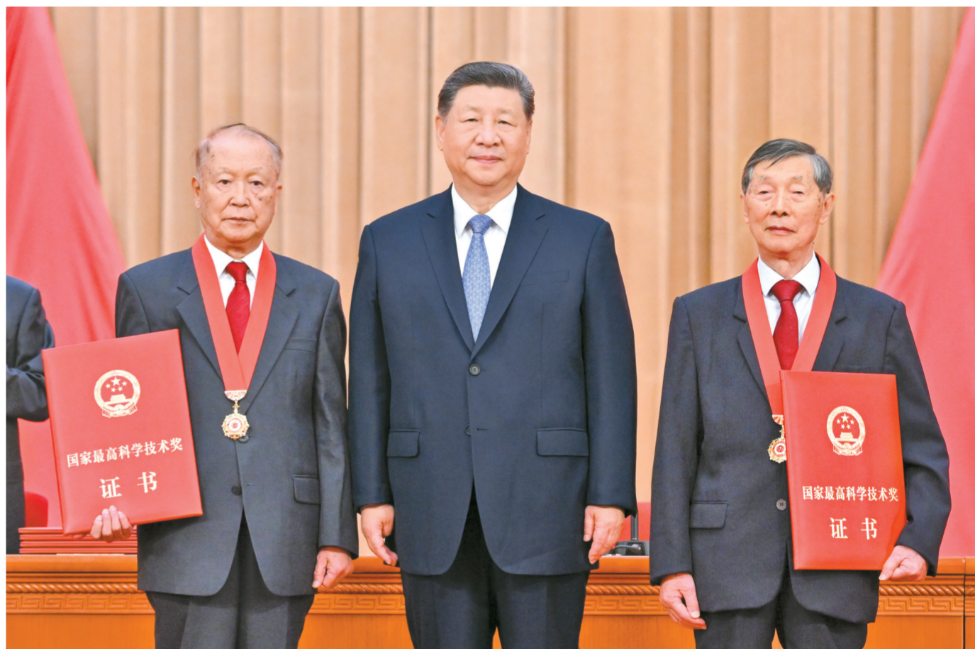
7月8日上午，国家科学技术奖励大会、中国科学院第二十二次院士大会和中国工程院第十八次院士大会、中国科学技术协会第十一次全国代表大会在北京人民大会堂隆重召开。中共中央总书记、国家主席、中央军委主席习近平向获得2025年度国家最高科学技术奖的中国科学院物理研究所陈立泉院士(右)和中国电子科技集团第十四研究所贾德院士(左)颁奖。

新华社北京7月8日电 国家科学技术奖励大会、中国科学院第二十二次院士大会和中国工程院第十八次院士大会、中国科学技术协会第十一次全国代表大会8日上午在人民大会堂隆重召开。中共中央总书记、国家主席、中央军委