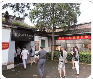
麻田八路军总部旧址