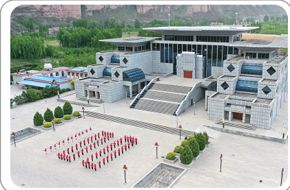
麻田八路军总部纪念馆