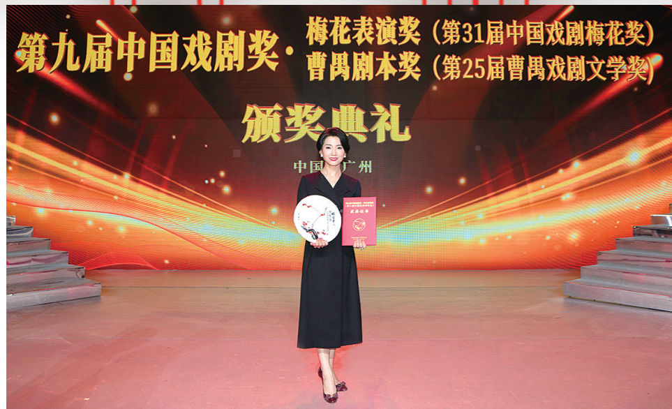
郑芳芳荣获第31届中国戏剧梅花奖

5月21日晚,第九届中国戏剧奖·梅花表演奖(第31届中国戏剧梅花奖)的颁奖典礼在广州大剧院举行,本届梅花奖获奖名单正式揭晓,晋中市演艺有限公司国家一级演员郑芳芳比赛成绩名列前茅,以总票数第三名、女演员第一名的佳绩顺利摘得本届“梅花”。