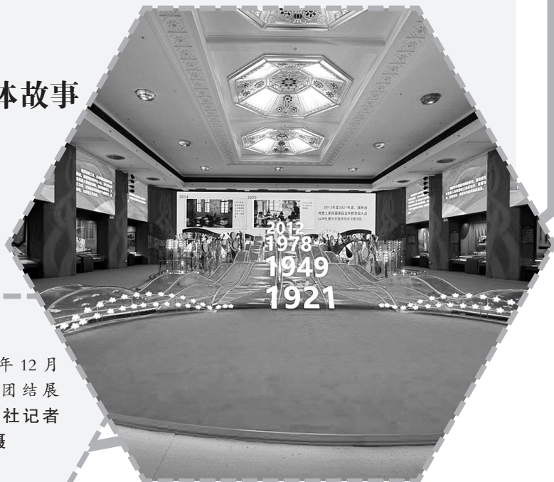
2023年12月28日，大团结展厅。