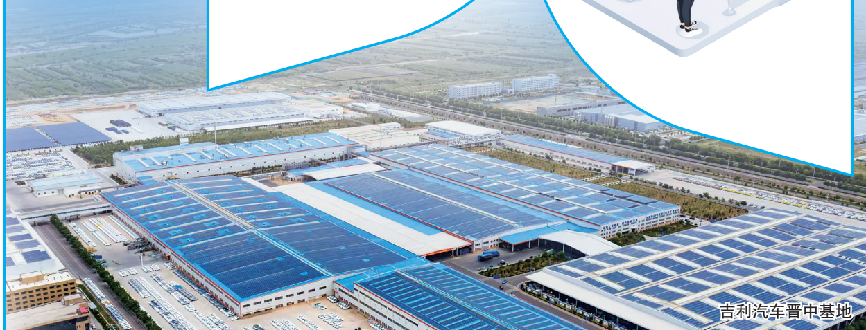
吉利汽车晋中基地