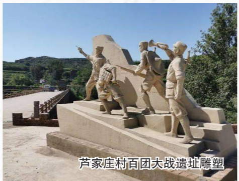
芦家庄村百团大战遗址雕塑

湿的岩壁上，似还留着战士们倚靠的体温；日本人修建的隧道入口已长满野草，却遮不住墙上的弹痕。“爷爷说当年他12岁，给战士们送过烙饼，饼渣掉在石缝里，后来长出了野草。”村中一位老人牵着孩子路过雕塑，指尖划过碑刻上的名字，红色记忆便这样代代相传。