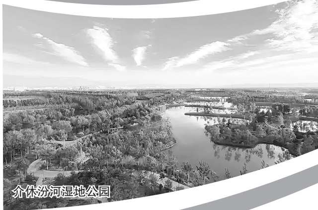
介休汾河湿地公园