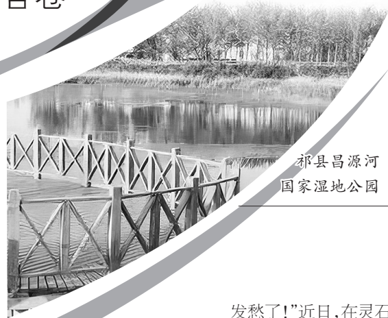
祁县昌源河国家湿地公园

平遥县汾河三坝库区，白天鹅、绿头鸭等候鸟悠然休憩，尽享冬日暖阳；祁县昌源河国家湿地公园内，黑鹳舒展羽翼，翩跹掠过碧波；和顺太行山间，白云漫卷之处，华北豹的身影在山川间灵动闪现……冬日的晋中大地，处处铺展着生态和谐的动人画卷。