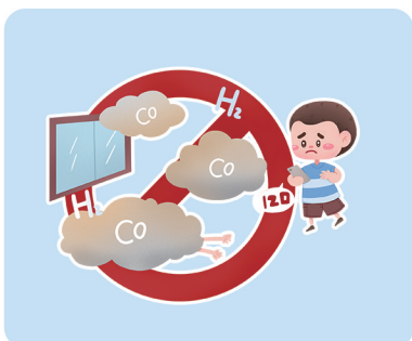
燃气泄漏时勿用任何电器和明火