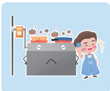
开燃气做饭切勿分心