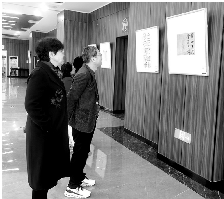
展览现场

本报讯（记者 武玲芳）墨香萦绕校园，雅韵浸润初春。3月21日上午，由晋中市文学艺术界联合会、晋中市书法家协会联合主办的“晋中市书法家协会首届会员书法小品展览”在晋中职业技术学院图文信息中心大厅开幕。展览以“小品”为媒，汇聚80余件精品力作，为现场200余名师生、书法爱好者带来一场沉浸式的文