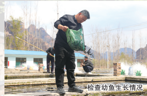
检查幼鱼生长情况