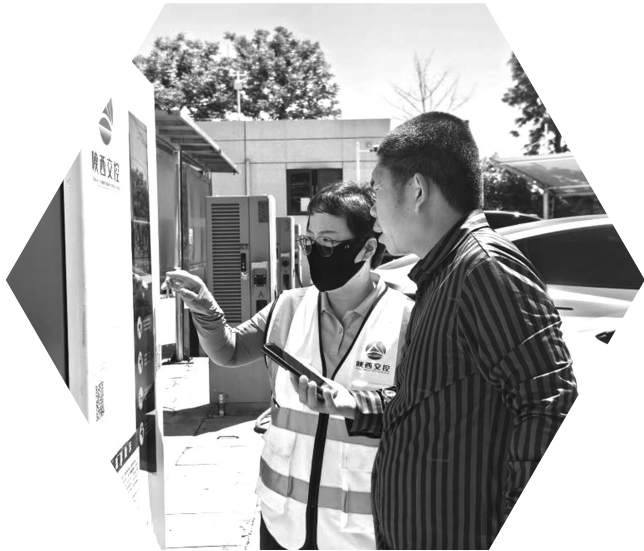
5月2日,陕西澄城服务区工作人员协助新能源汽车车主充电。