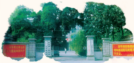
20世纪80年代正定县委大院外景。

最终，习近平同志坚持站在人民立场想问题，向上反映情况，争取政策支持。全县粮食征购任务减少了2800万斤，调整种植结构，“一减一加”让农民收入翻了番，生活真有了起色。