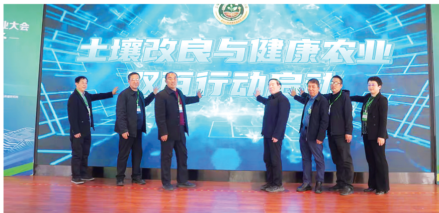
土壤改良与健康农业“双百行动”启动现场

基地、任村乡东贾村采椒基地、任村乡郝村葡萄基地、任村乡大郭村胡萝卜基地、绿美园林功能农产品采摘基地、晋