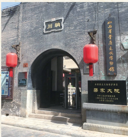
山西省晋商文化博物馆

匠心守护传承,馆藏文物历久弥新。走进晋中市博物馆,数万余件藏品静静陈列,上起旧石器时代,下至明清民国,完整勾勒出晋中文明发展脉络。平遥县博物馆建立文物安全标准化管理体系,筑牢消防安全防线。山西省晋商文化博物馆聚焦晋商文物保护,完善藏品档案。