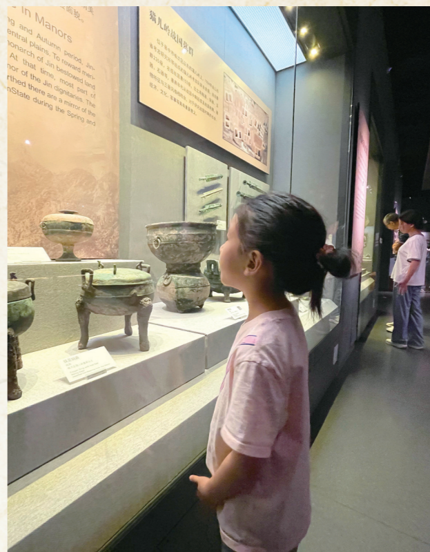
了解文物背后的故事

从全市文博全域数字化布局,到专题馆藏精准化活化,晋中以科技为桥、以文化为核,让文物在数字时代重焕光彩。(张颖)